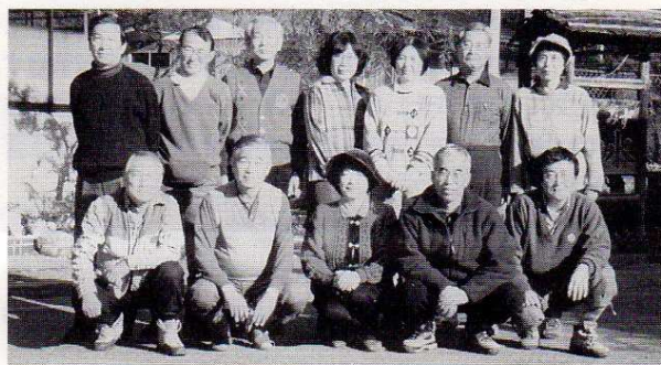
第21回 '96.12.15 奥多摩、小菅の里にて