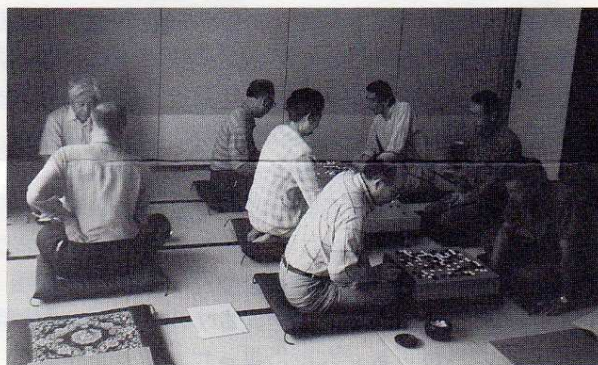
生涯学習センターにて