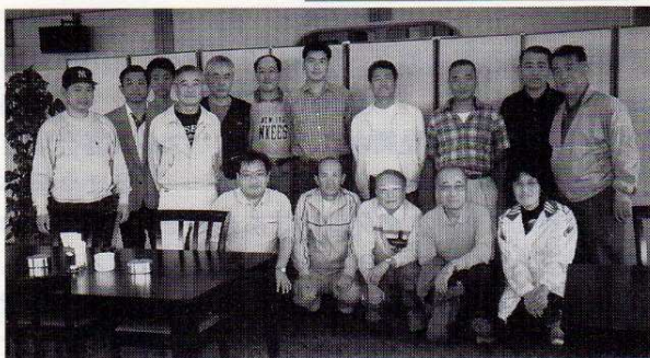
渋谷・世田谷両稲門会との交流試合のパーティーにて

ソフトボールは、老若男女を問わず誰でも気軽に出来るスポーツです。頭の中をからっぽにし身体を動かしたいと思う方は是非ご参加下さい。