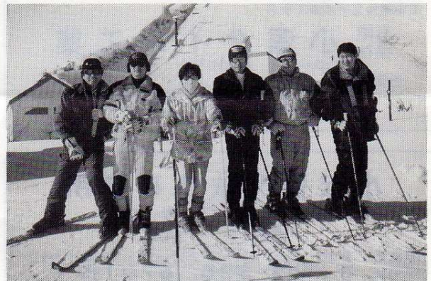
白馬 八方尾根にて