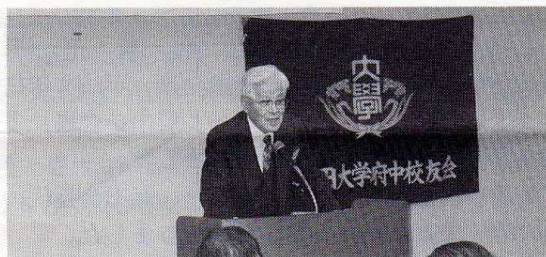
関田会長代行あいさつ

最後に福永副会長からの閉会の辞をもって、午後7時過ぎに無事全日程を終了致しました。