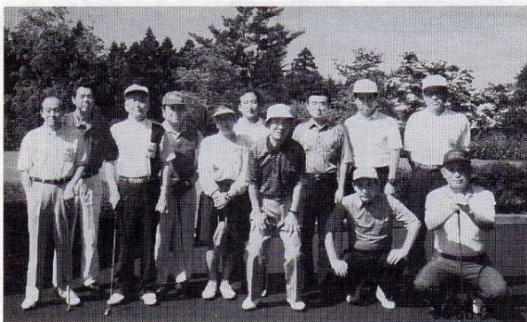
大月カントリークラブにて