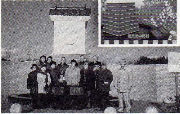
'97.12.13 福島県中島村「童里夢公園なかじま」 《カラクリ》ヨカッペ時計前にて

一年の締め括りに、楽しい一時を過ごさせて頂きまして、ありがとうございます。又、来シーズンを楽しみに期待しております。