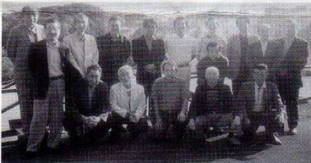
'03. 5. 29(木)立川国際カントリークラブにて