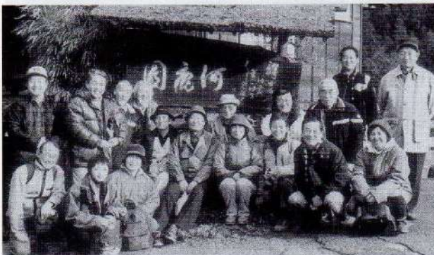
'03. 2. 8(土)10周年記念 御岳駅前 河鹿園(会席料理)にて

…とばかりに、有志の方々の発起で府中校友会の同好会=TM歩こう会=が発足し、早10年。この間の山行きは回を重ねること41回、その都度多士済々のメン