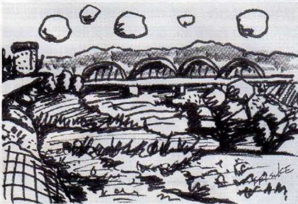
多摩川橋 風景 03. 5「マジックインキでのスケッチ」 (春陽会《油絵》研究会員・ゴルフ同好会メンバー)