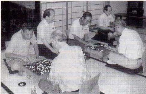
'03. 8. 9(土) 府中生涯学習センターにて