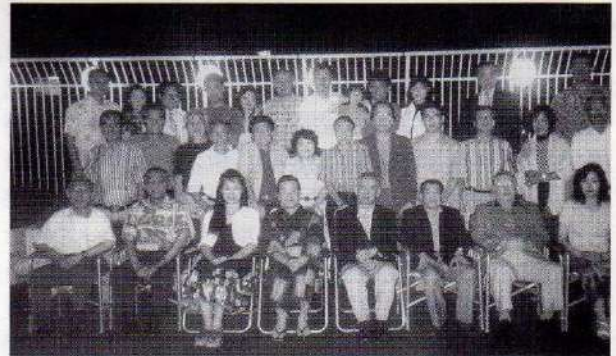
'03. 8. 31(日) 府中グリーンプラザ屋上ビアガーデンにて