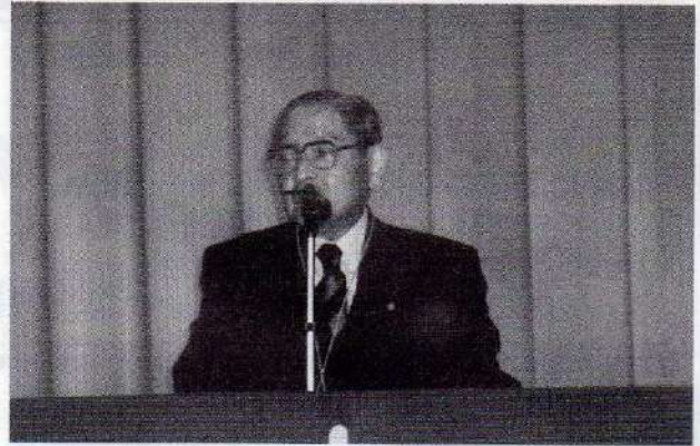
早稲田大学府中校友会 福永会長の挨拶