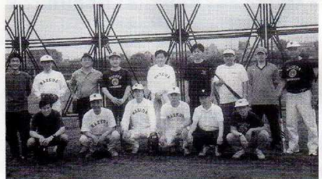
'03.5.24(土)二子玉川グラウンドにて 渋谷・世田谷各稲門会の皆さんと

12月から翌年3月までの間を除く毎週日曜日、朝7 時から9時まで関戸橋袂府中市野球場で有志による早 朝練習を実施しています。