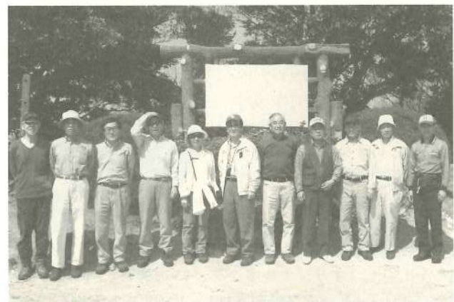
'08. 4. 6(土) 大楠山頂上にて(神奈川県三浦半島)

前田橋バス亭からJR逗子駅に着いたのは3時半、それぞれに「膝が痛い」「足がつった」などあったものの、さわやかな春の登山を楽しんだ。