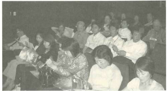
参加された皆さん