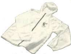
アクティブパーカー