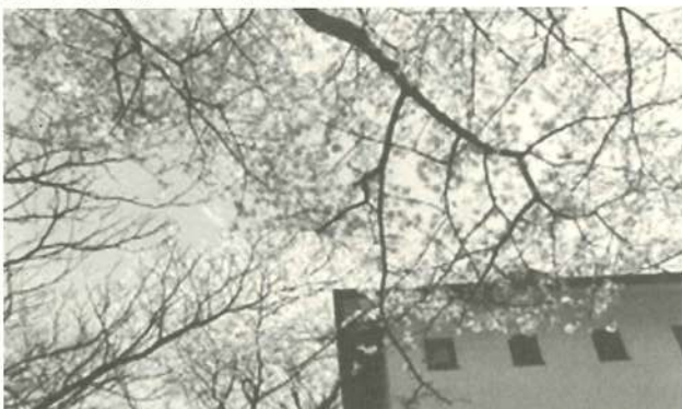
大楠山頂上付近の桜

そこを後に横須賀I. C. の下をくぐり抜け、民家の庭に咲く白やピンクの花桃を眺めながら、いよいよ登山道へ入ったものの、正規のルートとは思えない荒れた道に迷い込んだ。倒れた木や折れた枝が細い道に重なり、足元を取られそうになりながらも、折れた枝を杖に進んでいけば視界が開け、傍らには葉山国際カントリークラブが……。