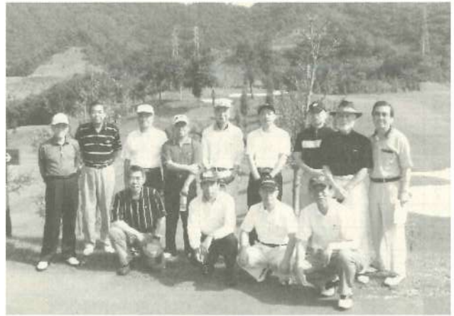
'08. 5. 23(金) 花咲カントリークラブにて (山梨県大月)