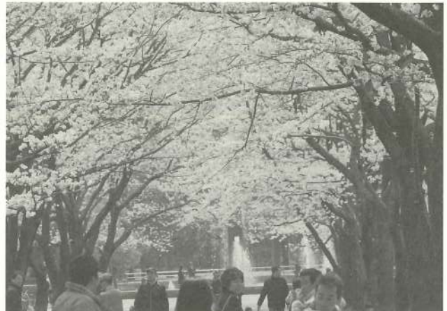
府中の森公園の満開の桜