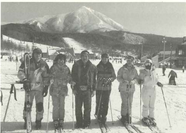
'10.1.29(金)～31(日) アルツ磐梯スキー場

写真等は府中校友会ホームページを参照して頂くと、みんなの楽しんでいるところがよくわかると思います。