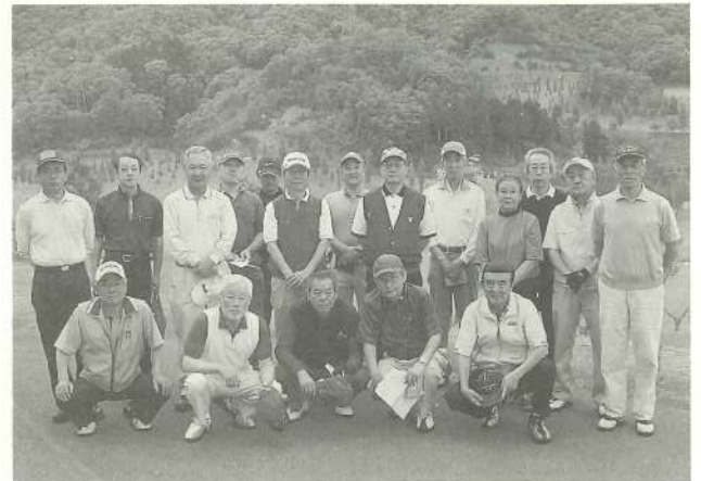
10.5.7 花咲カントリー倶楽部