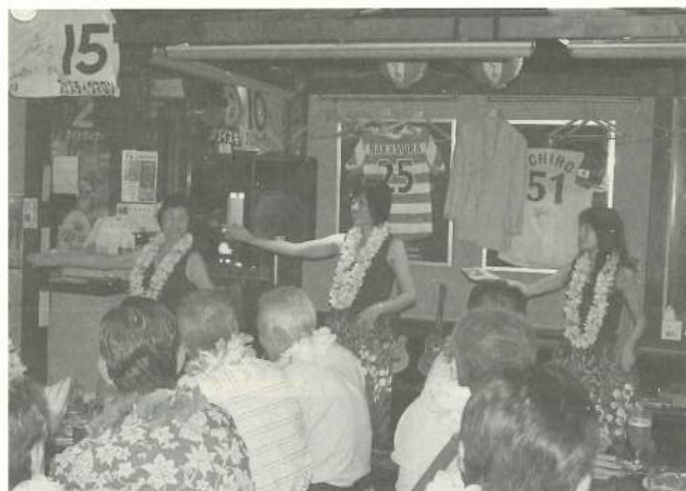
'10. 8. 29 生ビールで乾杯

「生ビールで乾杯」での発表を目標に、フラダンスやウクレレを主に自主練習で活動しています。フラダンスにおいてはチーム名を「府中 トーモン レフア」と命名、今年は3度の舞台に立ちました。多少の失敗もご愛嬌、和気藹々のチームです。来年は「都の西北」を踊ることを目標にしています。我こそはと思われる方、ぜひご連絡ください。