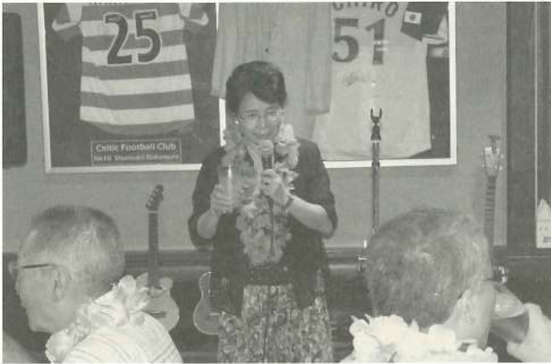
立川稲門会志村会長による来賓挨拶