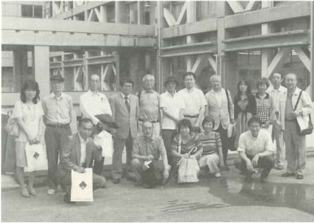
理工キャンパスにて集合写真