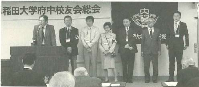
新幹事を紹介する大島会長