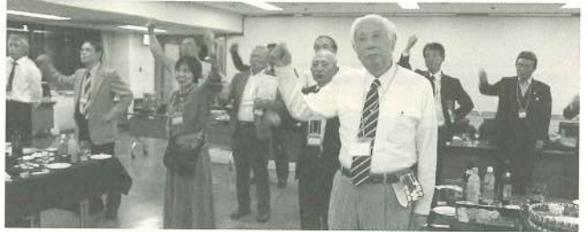
会場は右手を挙げて全員で校歌斉唱