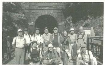
大日影 トンネル前にて

トンネルを出ると甘酸っぱい香りが漂い始め、ぶどう畑が果てしなく広がっているのが見える。収穫の終わった畑(主にデラウェア)もあるが、収穫を待つ