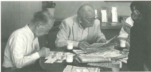
どんな選び方があるんだっけ？