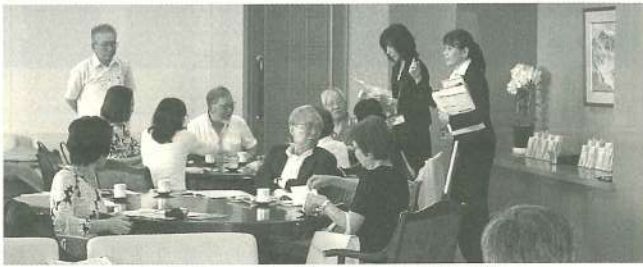
お手伝いいただいたJRA案内嬢